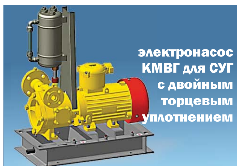
электронасос КМВГ для СУГ с двойным торцевым уплотнением