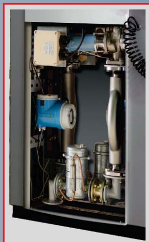
Блок гидравлики с массовым расходомером