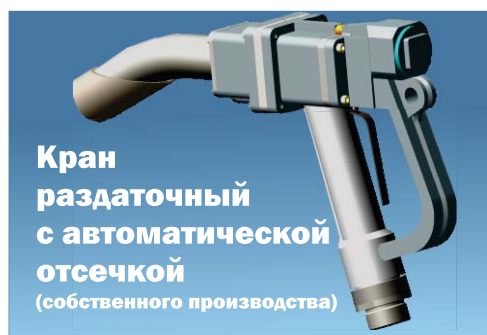
Кран раздаточный с автоматической отсечкой (собственного производства)