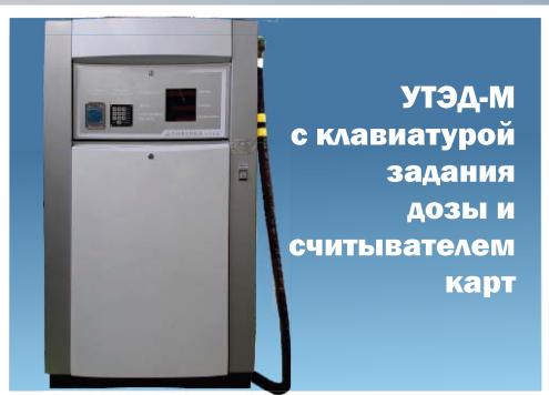
УТЭД-М с клавиатурой задания дозы и считывателем карт