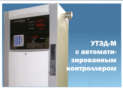
УТЭД-М с автоматизированным контроллером